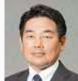
Shin Imai Director-General for Engineering Affairs Maritime Bureau Ministry of Land, Infrastructure, Transport and Tourism (MLIT)