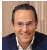
Wael Sawan CEO Shell Plc