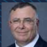
Patrick Pouyanné Chairman & CEO TotalEnergies