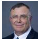
Patrick Pouyanné Chairman & CEO TotalEnergies