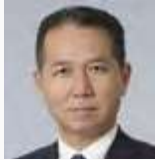
Yoshifumi Murase Commissioner, Agency for Natural Resources and Energy (ANRE) Ministry of Economy, Trade and Industry (METI)