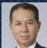
Yoshifumi Murase Commissioner, Agency for Natural Resources & Energy (ANRE) Ministry of Economy, Trade and Industry (METI)